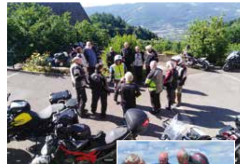
Lagebesprechung vor der Tagestour

Motorradurlaub bei den Hohroder Schwestern im Elsass vom 7.-12. Juni 2022